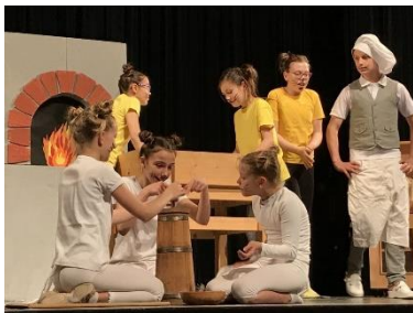
Fotografija prizora iz Pekarne Mišmaš, šol. leto 2016/2017.

OCENE: Učenci bodo pridobili po eno ustno oceno v ocenjevalnem obdobju.